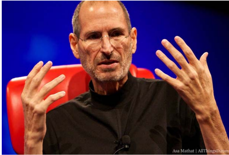
All Things D: D8, 2010 年 6 月 1 日