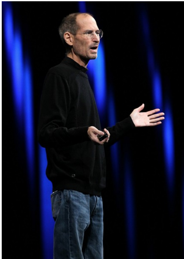
WWDC 2011, 2011 年 6 月 6 日