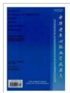
中华老年心脑血管病杂志