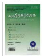
心血管康复医学杂志