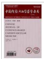
中国循证心血管医学杂志