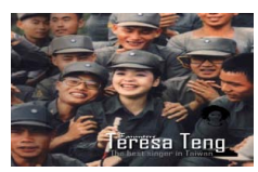
《福布斯》：全球独立亿 前不见古人后不见来者：邓