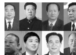
那些因情妇丑闻落马官员