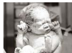
震撼! 实拍婴儿出生瞬间