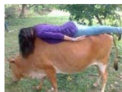
你们的节操哪里去了