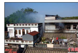
空军一架歼7飞机坠毁