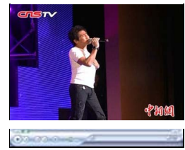
齐秦王杰迪克牛仔兰州开唱