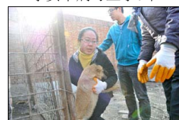
屠宰场解救待宰狗