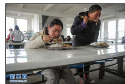
孝女带病母上学8年