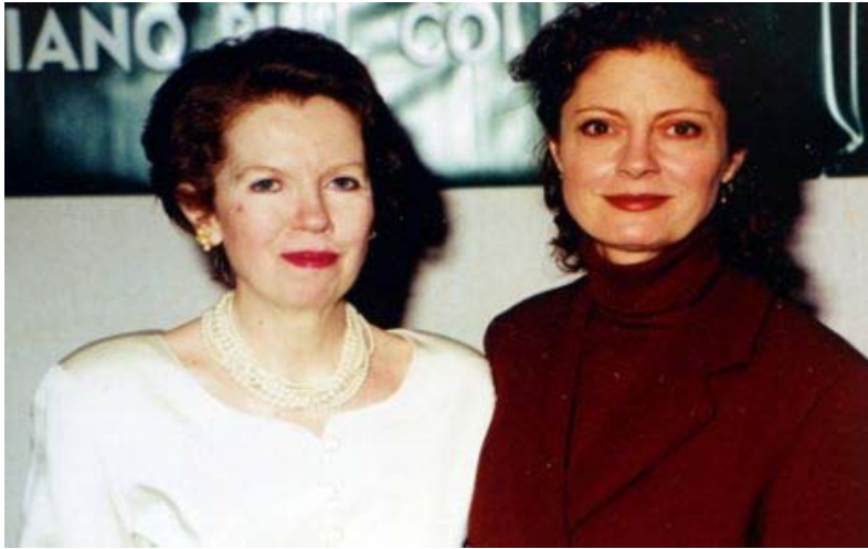
好友：麦克拉Odone与苏珊·萨兰登

结果我的父亲生气地喘着粗气，诺尔特让他听起来像一个冰淇淋供应商在纽约的小意大利（Little Italy）。与此同时，苏珊·萨兰登，自己一个虔诚的母亲，一丝不苟研究麦克拉，成为她的朋友，在这个过程中。