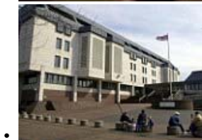
• 丈夫使用Facebook来捕获该名男子涉嫌强奸...