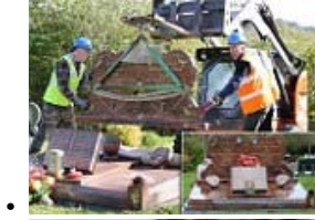
• 目前的情况是严重的：石匠万英镑的眼泪就下来了...