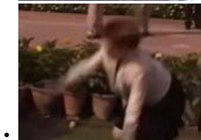
• 吉拉德的失宠：澳大利亚总理的那一时刻了...