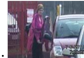
• 我们终于赢得了战斗对利益秘籍吗？...