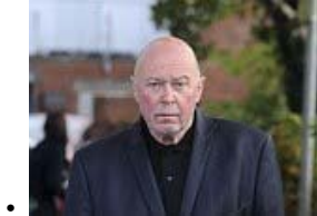
• 在后面拍摄的，5万伏泰瑟枪盲中风患者...