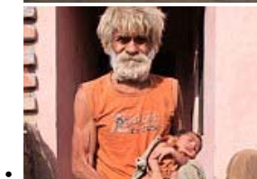
• 世界上最古老的父亲再次在96（当然，他也有...