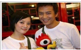
邓超王菲那英 盘点明星孩子爆笑名字