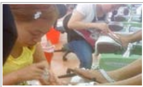
凤姐美国新照曝光 疑似做洗脚妹