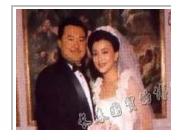
杨澜17年前婚照曝光 那年佳婿尚未发福