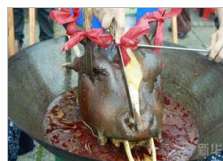
土家族“牛头宴”：吃起来十分鲜美