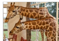
肯尼亚酒店回归自然 可与长颈鹿共进早餐